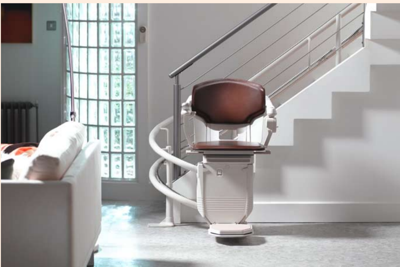
Die neue Generation der Treppenlifte passt sich jeder Einrichtung und jedem Wohnbereich an.

... sagt der Volksmund – und dies gilt bis heute. Denn noch immer fragen Menschen vor wichtigen Entscheidungen um Rat – ihre Familie, Freunde, Nachbarn oder auch die Experten. Seit ich mehrere Monate damit verbracht habe, einen neuen Fernseher zu suchen, weiß ich, wie froh und dankbar ich für den Expertenrat des Freundes war. Genau so geht es anderen Menschen auch, wenn sie einen Rat erhalten, eine Empfehlung, die ihnen hilft, die richtige Entscheidung zu treffen. Und als Ratgeber freut man sich, wenn man seine Erfahrung und sein Wissen weitergeben und einem anderen Menschen helfen kann.