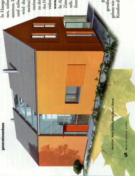
Architekt: Marc Fischer, Büro M+M+M, Bonn 48 MEIN EIGENHEIM 4/2005

@ Zwei Generationen unter einem Dach. Zu dem Thema fin- den Interessierten den Entwurf dieses Wohnhauses, dazu Grundrisse und textliche Erläuterungen. Im Internet unter www.mein-eigenheim.de/ generationenhaus