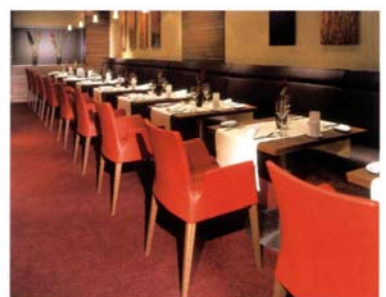
Lassen Sie sich verwöhnen, bei Meeresküche und mehr im Restaurant „Le Merou“