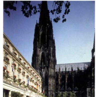
Am Fuße des Kölner Doms liegt das 1855 erbaute Dom Hotel, ein Le Méridien Grand Hotel.