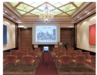
Die neue Dimension des Tagens erleben Sie in neun Konferenz- und Tagungsräumen mit Tageslicht, Klimaanlage, W-LAN und modernster Technik.